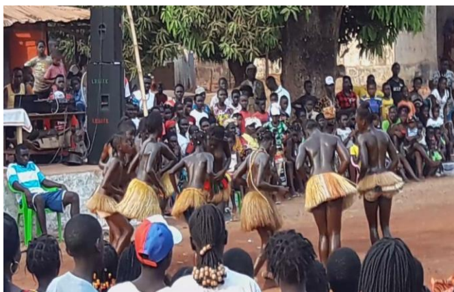
Carnaval in Empada februari 2019