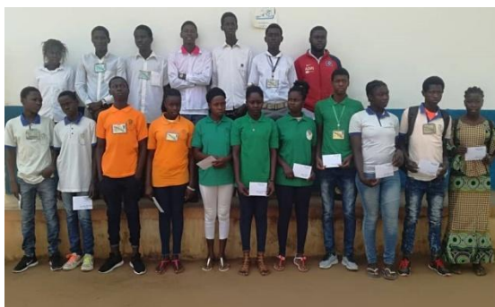
Beursleerlingen van het Lyceum