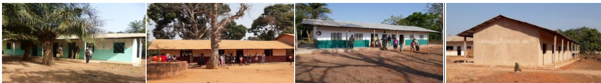
De nieuwe scholen in Binhal, Francunda, Gancumba en Dar Salam.

Stichting Sanjuna heeft in de afgelopen periode de bouw van scholen en aanschaf van meubilair in vier dorpen ondersteund met in totaal 9 lokalen voor ~320 leerlingen (zie foto's). Daarnaast ontving de openbare school in Empada (700 leerlingen, 14 klaslokalen en 30 docenten) tweemaal een bedrag om zeer noodzakelijk onderhoud en herstel te plegen : bouwkundige verbeteringen, sloten op deuren, verf op de schoolborden, archiefkasten en -mappen, meubilair, omheining etc. Deze aangebrachte verbeteringen motiveerden de ouders van leerlingen om een bescheiden maandelijkse bijdrage te gaan betalen, waarmee docenten een extra toelage ontvangen. In ruil daarvoor doen de leerkrachten niet meer mee aan landelijke stakingen.