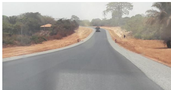
De nieuwe asfaltweg nabij Empada

In deze failed state zijn de publieke voorzieningen zeer zwak georganiseerd: bestuur, rechtspraak, onderwijs en gezondheidszorg. In de hoofdstad proberen ambtenaren, militairen en kleine zelfstandigen met hun families te overleven. In de periferie moet iedereen een landje bewerken om aan de kost te komen: verbouw van cashewnoten, pinda's, rijst, bonen, en visserij zijn de belangrijkste inkomensbronnen. Zodoende is buiten de hoofdstad Bissau bijna iedereen boer (naast eventueel een andere baan). Vruchtbaar land is er in de sector Empada genoeg. De kunst is om efficiënt en effectief te produceren. Transport is daarbij een belangrijke randvoorwaarde. In het zuiden is na 35 jaar praten en beloven een asfaltweg gereed gekomen, die Empada-stad tot op 12 km nadert. In Empada-stad is een watertoren geïnstalleerd, waaraan een waterleiding is verbonden. Op verschillende plekken langs de hoofdstraat zijn watertappunten gemaakt en is een aantal woningen op deze waterleiding aangesloten. Elektriciteit was decennialang in Empada alleen via een privégenerator beschikbaar en in enkele gevallen op basis van zonne-energie. Maar in 2019 is de elektriciteitscentrale in Buba gereedgekomen die het openbare net in Empada (net als in enkele andere grote plaatsen in het zuiden) tussen 19.00 en 02.00 uur van stroom voorziet. Uiteraard blijft het afwachten welk deel van het jaar deze centrale functioneert.