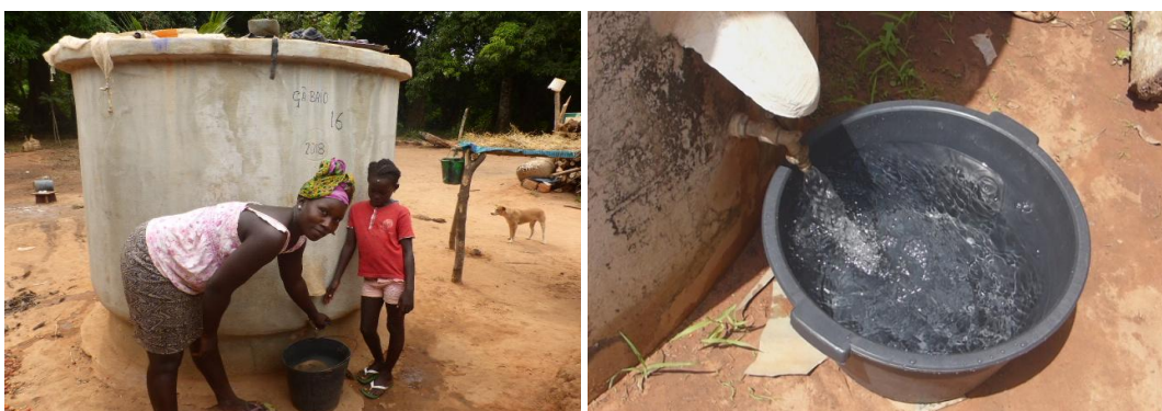
Opvangtank voor regenwater - levert prima kwaliteit drinkwater

Op het gebied van hygiëne en gezondheid bestaan veel knelpunten: de kinder- en moedersterfte is hoog en ook volwassenen zien we vaak overlijden zonder dat adequate diagnostiek en behandeling hebben plaatsgevonden. Hygiëne, gezondheid en economische ontwikkeling beginnen met de beschikbaarheid van voldoende en schoon drinkwater. Dat is direct al een knelpunt in veel dorpen. Het land ligt op de rand van de Sahel. Op zich valt in het zuidwesten van Guinee-Bissau heel wat regen in de periode juni-oktober, maar daarvóór, aan het eind van de droge tijd (april/mei), vallen veel waterputten droog, terwijl dan (de oogsttijd van de cashew) juist veel drinkwater nodig is. In de afgelopen periode zijn, veelal met financiering uit verschillende bronnen, jaarlijks enkele tientallen betonnen opvangtanks voor regenwater (5.000 L) gebouwd, die een prima kwaliteit drinkwater leveren, juist om die moeilijke periode te overbruggen.