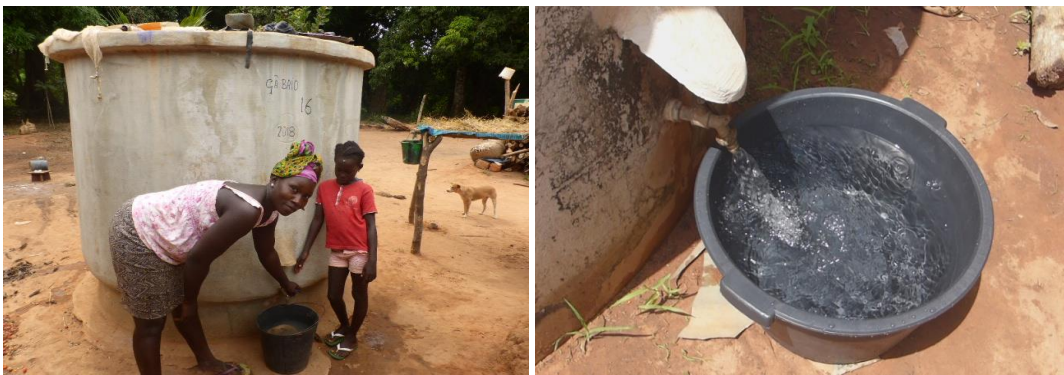
Opvangtank voor regenwater - levert prima kwaliteit drinkwater

Op het gebied van hygiëne en gezondheid bestaan veel knelpunten: de kinder- en moedersterfte is hoog en ook volwassenen zien we vaak overlijden zonder dat adequate diagnostiek en behandeling hebben plaatsgevonden. Hygiëne, gezondheid en economische ontwikkeling beginnen met de beschikbaarheid van voldoende en schoon drinkwater. Dat is direct al een knelpunt in veel dorpen. Het land ligt op de rand van de Sahel. Op zich valt in het zuidwesten van Guinee-Bissau heel wat regen in de periode juni-oktober, maar daarvóór, aan het eind van de droge tijd (april/mei), vallen veel waterputten droog, terwijl dan (de oogsttijd van de cashew) juist veel drinkwater nodig is. In de afgelopen periode zijn, veelal met financiering uit verschillende bronnen, jaarlijks enkele tientallen betonnen opvangtanks voor regenwater (5.000 L) gebouwd, die een prima kwaliteit drinkwater leveren, juist om die moeilijke periode te overbruggen.