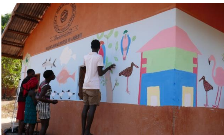
Foto muurschildering: de grutto en de stern pendelen tussen Nederland en Guinee-Bissau